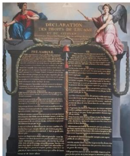
Déclaration des droits de l'homme et du citoyen - Le Barbier 1789 (Hall de la Sous-Préfecture de Fontainebleau)

Le monde d'aujourd'hui se construit en regardant le passé, comme si le futur ne pourrait pas se conjuguer avec l'audace, la liberté et la responsabilité. Le passé semblerait représenter le bien, peut-être parce qu'il nous est connu et qu'il nous titille la corde nostalgique. Quant au futur lui, il serait tenter de représenter un mal absolu. Il est à parier que de nos jours, la tour Eiffel n'aurait jamais pu apparaître grâce à nos technocrates de tout poil, petits esprits chagrins, méthodiques et créateurs prolifiques de normes parfaitement inutiles. Lorsque l'on construit l'avenir avec le regard du passé, on a les drames d'aujourd'hui !