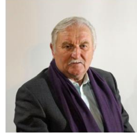
Gérard CHANCLUD La Chapelle-la Reine Projet de cohérence territoriale